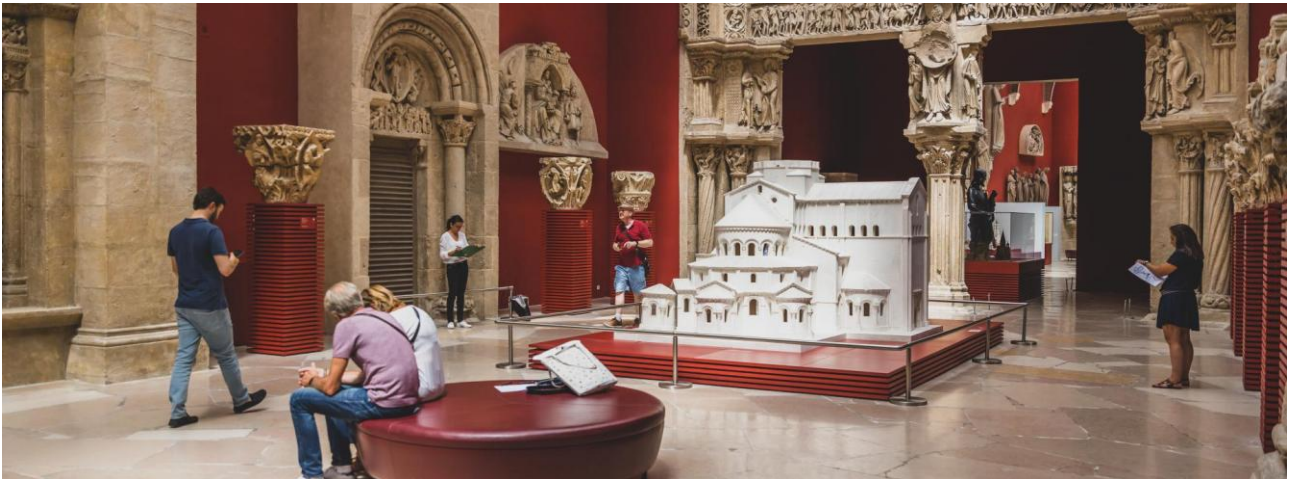
Galerie des moulages.

Première galerie traversée par les visiteurs, la galerie des moulages impressionne par la taille des moulages qui la compose et la variété des décors. La hauteur sous plafond de près de 14 mètres et sa verrière d'époque marque les esprits.